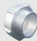
ADAPTADOR METRICO / NPT PARA ACOMETIDA DE MOTORES